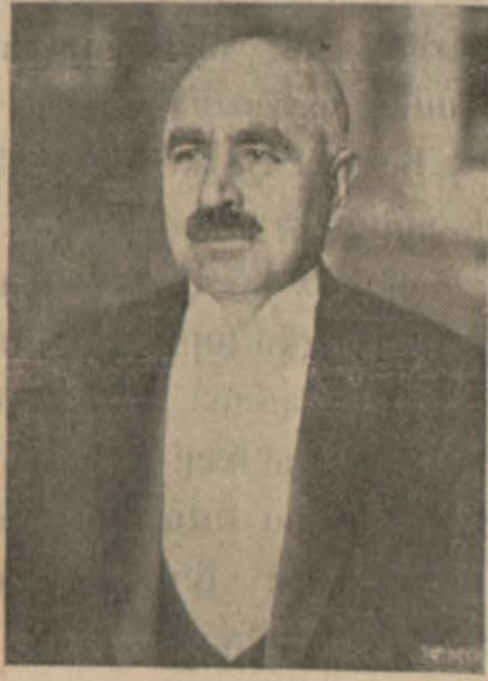
Mersin Halkının Güvendiği Değerli Nafia Bakanımız

Genel menfaatlerin korunmasını baş iş sayarak ulusu imtiyazlı ve hususi şirketlerin soygunculuğundan kurtaran Türk Cumhuriyetinin Nafia Bakanlığına Mersinliler için